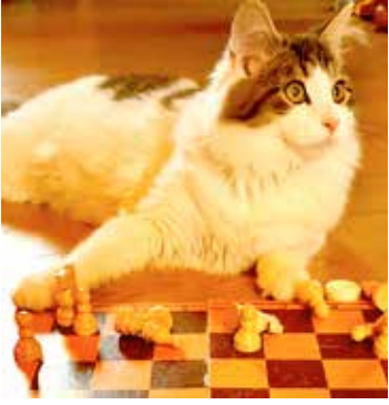
Naminiai gyvūnai COVID-19 neplatina, tačiau gali platinti kitas ligas, todėl po kontakto su gyvūnu būtina plautis rankas.

Prancūzijos maisto, aplinkos ir darbuotojų sveikatos ir saugos agentūra (ANSES) paskelbė, kad naminiai gyvūnai ir gyvuliai neplatina koronaviruso COVID-19. Tokias išvadas mokslininkai pateikė išnagrinėję visus šiuo metu turimus mokslinius duomenis apie naująjį koronavirusą. Analogiškas išvadas patvirtino ir Pasaulio gyvūnų sveikatos organizacija (OIE), Pasaulio sveikatos organizacija, Jungtinių Amerikos Valstijų ligų kontrolės ir prevencijos centras ir kitos tarptautinės organizacijos.